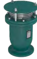
Kinematik Vantuzlar Sayfa 6