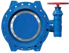
Kelebek Vanalar Sayfa 7