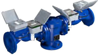
Hidrolik Hidrantlar Sayfa 3