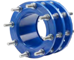
Demontaj Parçaları Sayfa 8