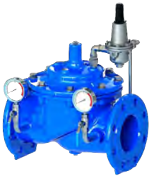
Hidrolik Kontrol Vanaları Sayfa 9