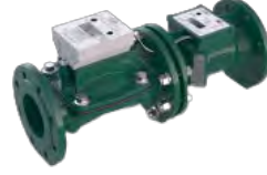
Ön Yüklemeli Ultrasonik Sayaçlar Sayfa 4